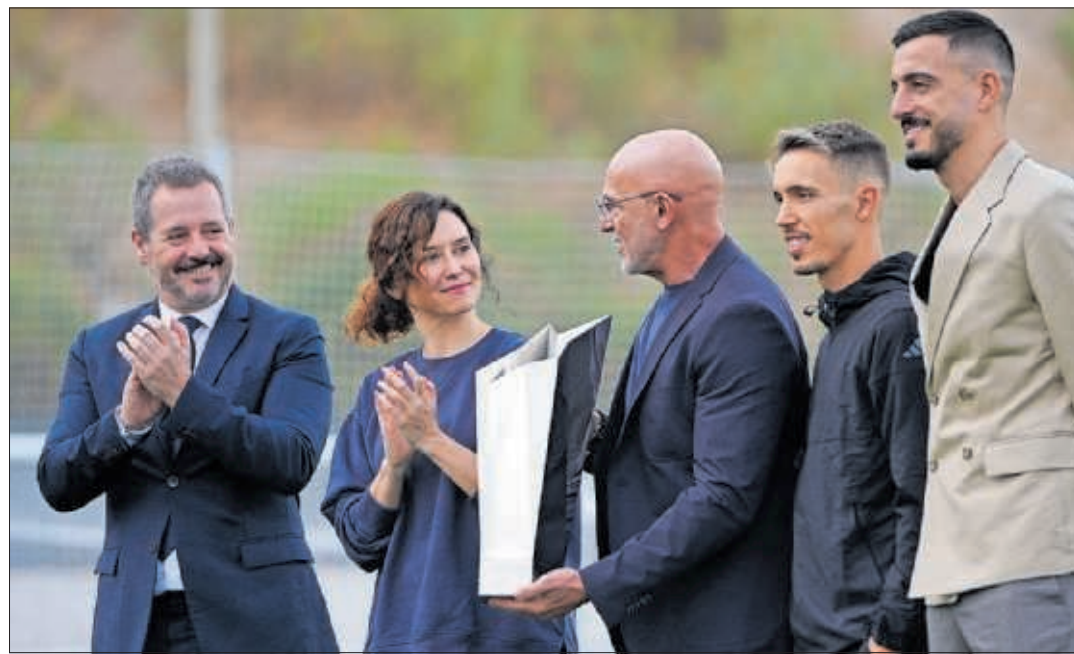
De Paco Serrano, Díaz Ayuso, De la Fuente, Grimaldo y Joselu, con el Premio Internacional del Deporte.