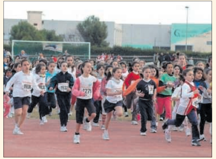
Una multitud de niños corre durante una carrera escolar.

serán 23 las federaciones deportivas participantes y un total de 30 modalidades deportivas ofertadas en 220 institutos de educación secundaria, 25.000 estudiantes y 1.200 escuelas de modalidades deportivas. Las actividades son dos días por semana (1,5h/día) con técnicos de las federaciones. El precio es de 14€ al año.