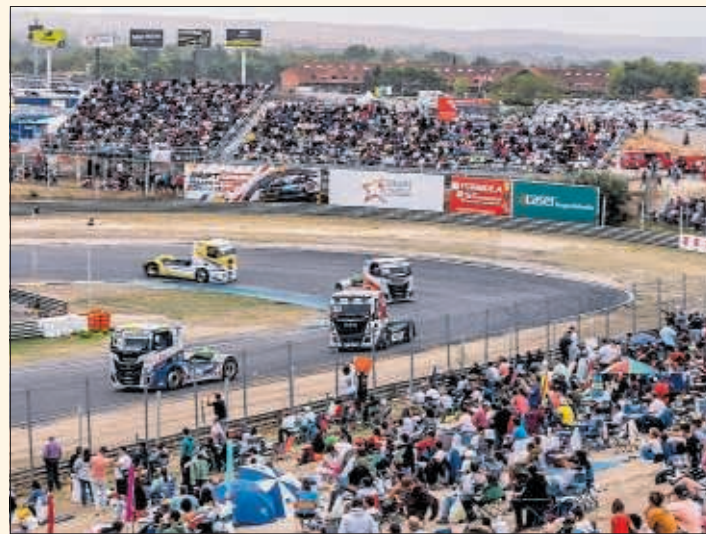
Gradas abarrotadas para ver la carrera en el Jarama-RACE.