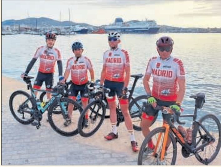
El equipo madrileño, antes de la prueba en Ibiza.