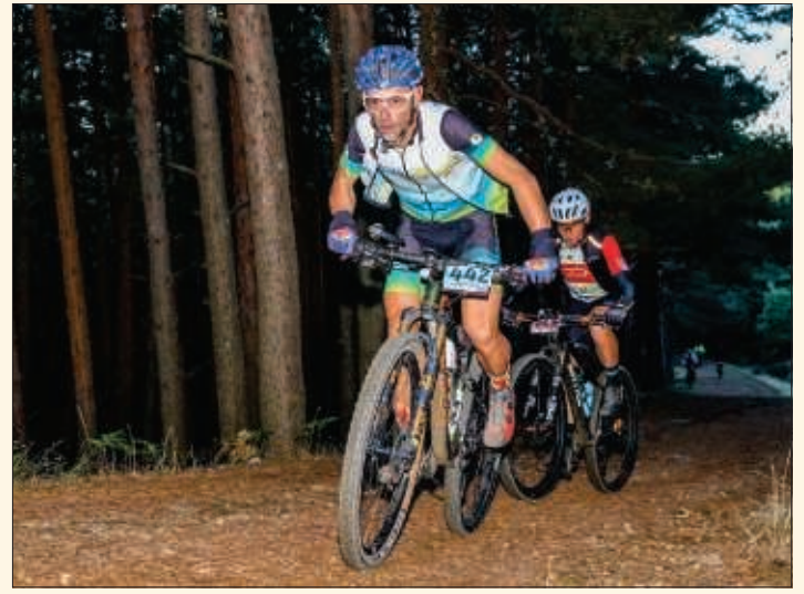
Acción en el pasado Campeonato de España de XC Ultramaratón.