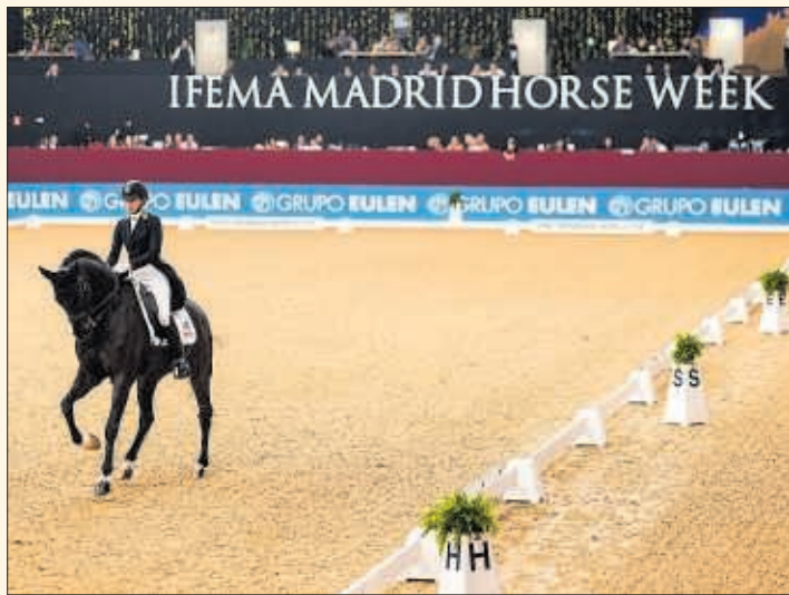
Momento de la pasada edición de Madrid Horse Week en IFEMA.