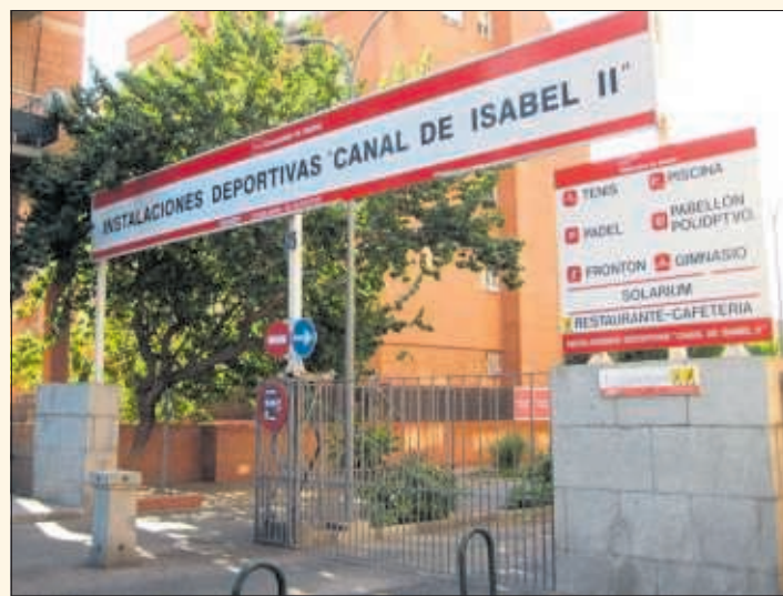
Entrada a las instalaciones deportivas del Canal de Isabel II.

La reforma integral, prevé, igualmente, la construcción de otra pista de pádel, que se sumará a las cuatro existentes; la mejora de la superficie destinada a la práctica de tenis de mesa y la renovación total de las siete pistas de tenis. En el caso de las de tierra batida, se cambiará su pavimento y el sistema de drenaje.