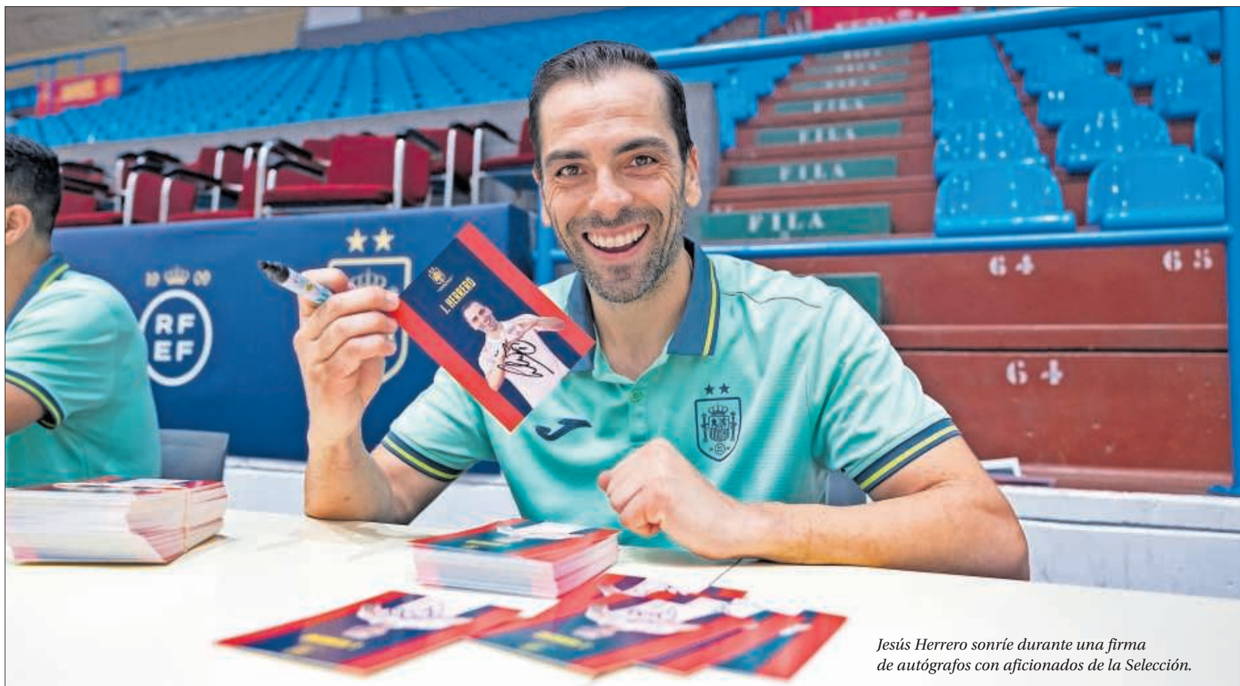
Jesús Herrero sonríe durante una firma de autógrafos con aficionados de la Selección.