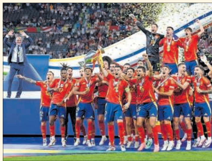
La Selección española de fútbol levanta la Eurocopa de 2024.

perfección la juventud y veteranía de sus jugadores con el talento y entrega. Durante la Eurocopa 2024, ha ganado todos sus partidos desplegando un gran nivel y juego. La Selección suma su nombre al palmarés de un galardón que han recibido figuras como Rafael Nadal (2008), Pau Gasol (2009) o Fernando Alonso (2011).