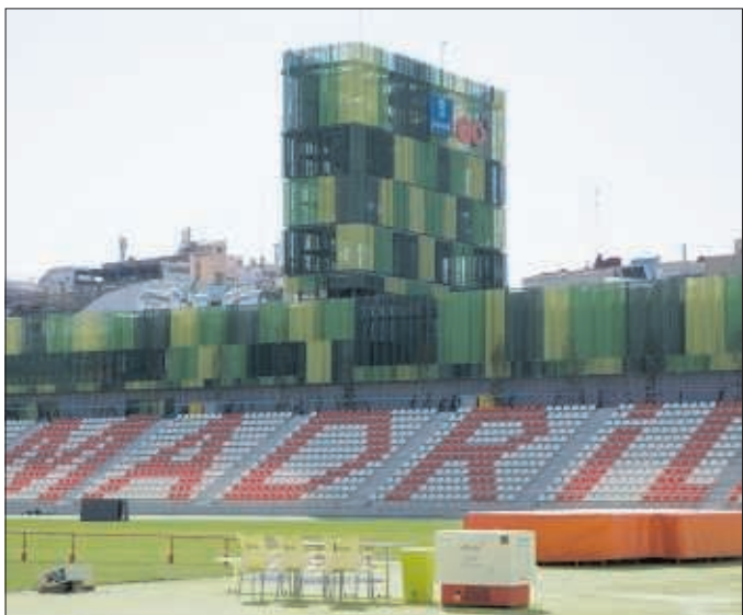
Estadio de Vallehermoso en Madrid.