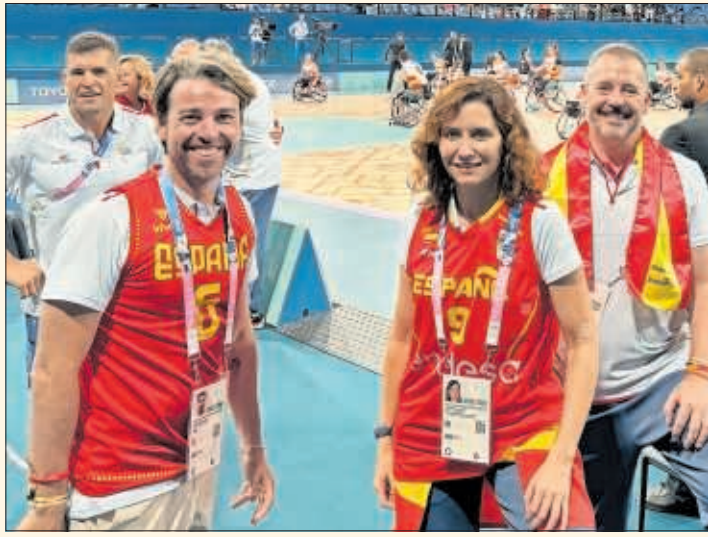
Díaz Ayuso y De Paco Serrano, en el Arena Bercy de París.