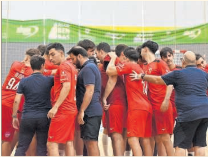
La plantilla del Alcobendas hace una piña.