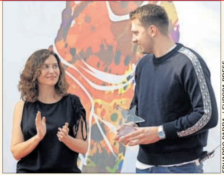
Isabel Díaz Ayuso aplaude a Luka Doncic durante el acto.

por el Gobierno regional y en el que el Real Madrid se apuntó la victoria. La presidenta explicó que la CAM da mucha importancia al deporte en todas sus dimensiones. En el caso del baloncesto, tras el fútbol y el golf, es el deporte con más licencias deportivas, con un total de 77.594 federados y 489 clubes.