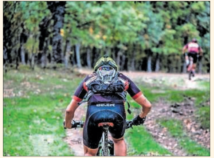
Un participante, durante un momento de la etapa.

económica y social de la zona y a la descentralización y diversificación de la oferta turística. De las tres carreras que se celebraron, la SNBC Non Stop, que alcanzó su octava edición, tuvo un recorrido de más de 200 kilómetros, y se desarrolló en el anillo ciclista de la Sierra Norte, Ciclamadrid MTB Tour.