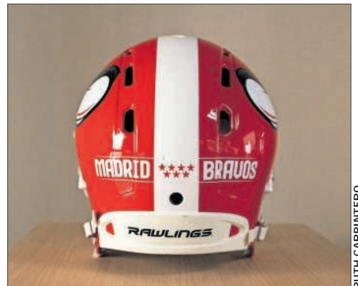
El casco del equipo de fútbol americano Madrid Bravos.

Los Madrid Bravos se incorporarán a la ELF para la temporada 2024, la cual arrancará en junio y en la que habrá 17 franquicias de ciudades tan distinguidas como Berlín, Praga, París, Barcelona... Para la confección del primer equipo de fútbol americano profesional de Madrid, el proyecto se nutrirá del talento de la zona (Camioneros de Coslada, Osos de Rivas, LG OLED Las Rozas Black Demons...) y también se realizarán entrenamientos a puerta abierta para captar jugadores. Próximamente, además, se anunciará la composición del staff técnico y el estadio en el que se jugarán los partidos.