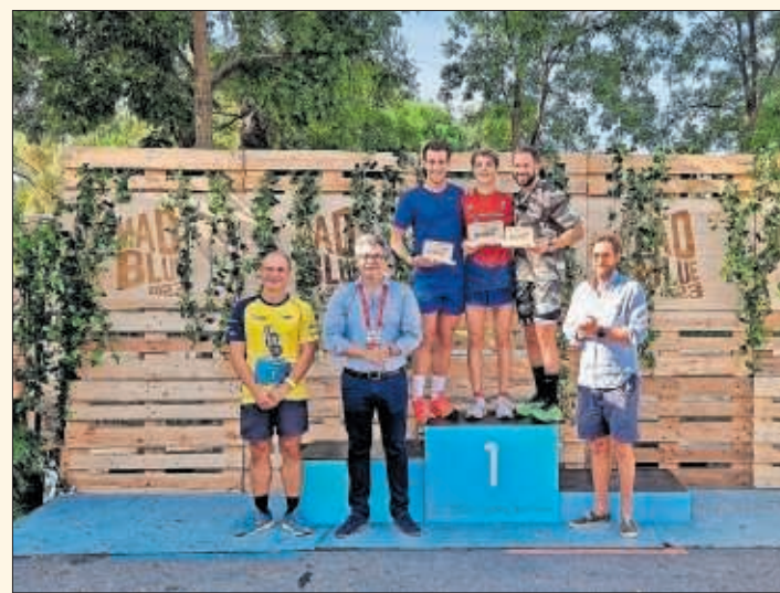
Celebración del podio tras la finalización de la carrera.

deportivas que además fomentan una vida saludable y una mejora de la calidad de vida”. Una parte de los beneficios que se obtuvieron de la MadBlue Run for the Earth se destinarán a la Fundación Piel de Atún, organización solidaria que trabaja en el cuidado y protección del medio ambiente.