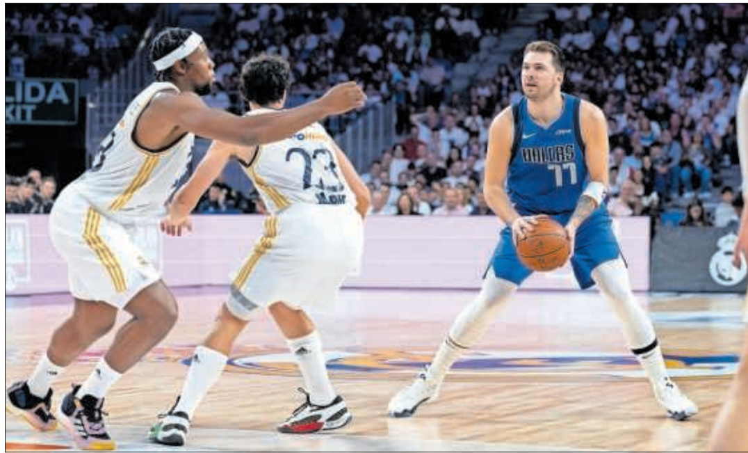
Luka Doncic se prepara para un lanzamiento durante el partido entre Dallas Mavericks y Real Madrid.

Diario as | viernes, 13 de octubre de 2023