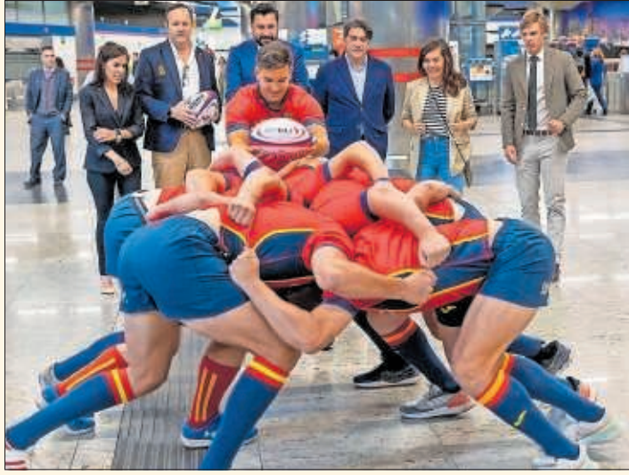
Los jugadores realizan una melé en el Metro de Madrid.