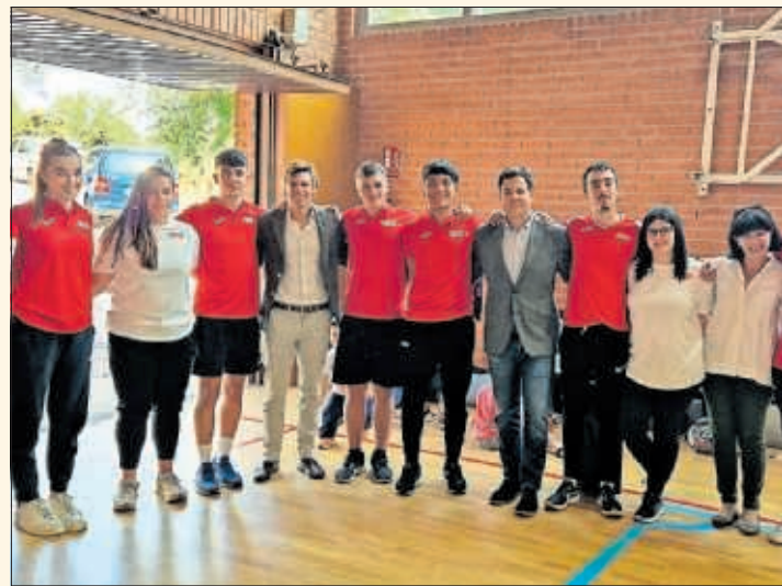
Inauguración del programa Todos Comunidad Escolar.

diferentes disciplinas, como atletismo, bochas, judo, karate, piragüismo y balonmano, con el objetivo de visibilizar y normalizar su práctica entre este colectivo y poner de manifiesto las diferentes opciones para llevarlas a cabo. También contribuye a la captación de deportistas y al desarrollo de competiciones adaptadas.