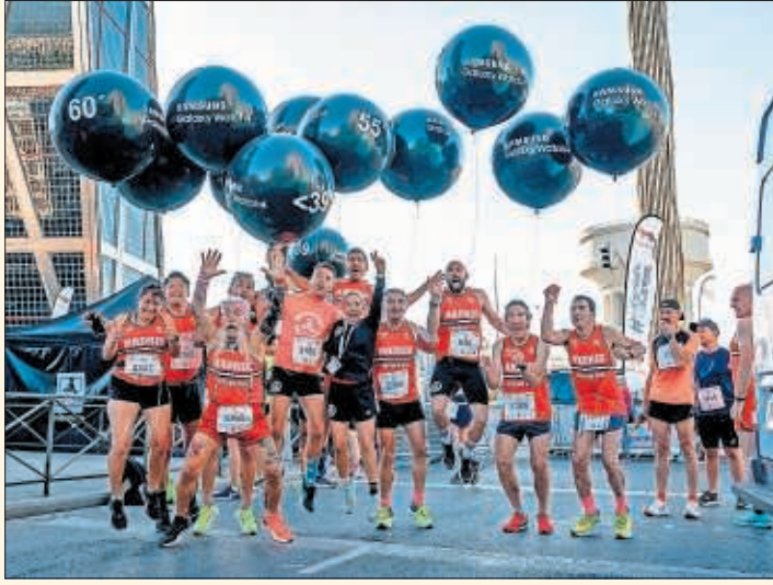
Participantes de la pasada edición de Madrid Vintage Run.